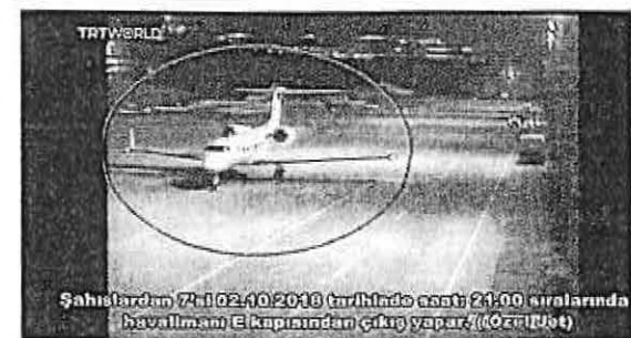
Sahistardan 74-1102-10/2018 (tr)Hindoo esatı 21:00 sıralarında havallmanı E.kapısından çıktı yapar. (Öznel) (TRT World)

NEL COMANDO ANCHE TRE UOMINI DEL PRINCIPE BIN SALMAN TRUMP: «ADESSO RIAD SPIEGHI»