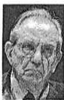
Il ministro dell’Economia, Pier Carlo Padoan

dell’1 a 0. La ricerca ha messo a segno il secondo gol rimarcando un elemento fondamentale: lo Stato non può indicare quali investimenti queste istituzioni devono mettere in atto, ma al massimo può fissare dei principi-quadro. «Che per via legislativa possano essere dettati principi generali per la gestione e per gli investimenti delle casse si può anche ammettere», ha spiegato Franco Bassanini. «Ma l’attuazione dei principi dovrebbe essere riservata all’autoregolamentazione degli stessi istituti». Ed ecco la proposta di tregua col governo: «Tuttalpiù si potrebbe pensare, riprendendo il modello già sperimentato con successo dalle fondazioni di origine bancaria, a un codice di autoregolamentazione proposto dalle casse e poi negoziato e concordato, tramite un protocollo d’intesa, con le amministrazioni interessate, ovvero i ministeri dell’Economia e del Lavoro».