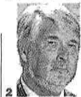
Pier Paolo Baretta (1), sottosegretario al Mef e il ministro del Lavoro, Giuliano Poletti (2)

Un assist, questo, che non poteva non essere immediatamente raccolto da Alberto Oliveti, presidente dell’Adepp, l’associazione delle casse di previdenza private, che proprio la scorsa settimana ha presentato l’annuale rapporto sugli investimenti: «I nostri patrimoni sono dei nostri associati, e devono essere investiti con il fine di massimizzare i rendimenti, che serviranno, insieme ai contributi, a pagare le pensioni del futuro. Siamo ovviamente disponibili a valutare insieme al governo un codice di autovalutazione degli investimenti, che permetta di approcciarsi alle best practices, alla gestione professionale del rischio e alla semplificazione». Ma non, evidentemente, ad approcci dirigitici da parte dello Stato. In altre parole, i professionisti non vogliono esser costretti a investire i loro patrimoni in un certo modo piuttosto che in un altro: «Niente vincoli e niente obblighi», dice Oliveti. «Inoltre il sistema dei controlli deve essere semplificato: basta con i nove organismi di controllo sulle casse che, a vario titolo, ci sono oggi. Ma la vigilanza deve essere efficace».