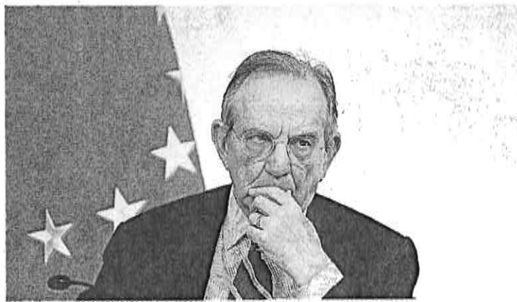
Il ministro dell'Economia, Pier Carlo Padoan

ROMA Una norma transitoria per tassare le multinazionali del web che fanno affari in Italia in attesa che l'Europa si muova per regolamentare un settore che, al momento, è completamente privo di regole. Il governo accarezza l'ipotesi di inserire la web tax nella manovra di correzione dei conti pubblici all'esame del Parlamento. «Ci stiamo ragionando, l'auspicio è quello di fare in tempo ad inserire una norma ad hoc nel decreto» spiegano fonti del Tesoro riconoscendo che il tema, soprattutto dopo i casi Google ed Apple, che hanno chiuso il contenzioso con il fisco italiano (mentre Amazon è sotto indagine per presunta evasione fiscale relativa al quinquennio terminato nel 2014 per un giro di affari da 2,5 miliardi di euro) accettando una transazione sulle imposte non versate negli ultimi