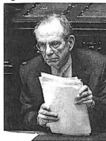
Il ministro Padoan

transizione, il prossimo, nel quale l'agevolazione contributiva spetterà anche ai lavoratori fino a 34 anni, a condizione che si tratti del primo contratto. Confermate anche le misure per le politiche attive del lavoro, tra cui il rafforzamento in caso di crisi aziendali del ricorso all'assegno di ricollocazione. Sul "superticket" sanitario applicato dalle Regioni il governo darà un segnale, stanziando risorse per un suo parziale superamento. Sul fronte delle coperture il governo, che non vuole ritoccare nessuna aliquota fiscale, punta sul maggiore gettito derivante dalla lotta all'evasione. Già nel decreto fiscale è stato previsto -